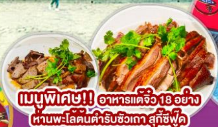
เมนูพิเศษ!! อาหารแต่จิว 18 อย่าง ผ่านพะโล้ต้นตำรับชวเกา สุกชีฟู้ด