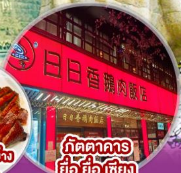
ภัตตาคาร ย้อ ย้อ เชียง