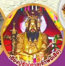
เฮียงบู๊ซิว (ศาลเจ้าพ่อเสือ)