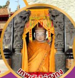
เทพเจ้าไต้ยงก