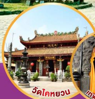
วัดโคทหยวน