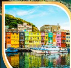
ท่าเรือเจิ้งปิ่น