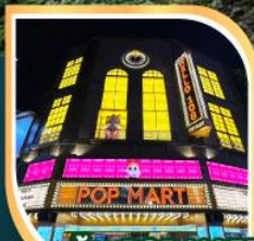
ร้านPOP MART ที่ใหญ่ที่สุดในไต้หวัน