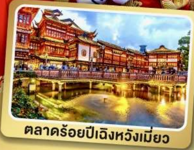
ตลาดร้อยปีเฉิงหวงเมี่ยว