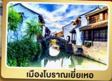
เมืองโบราณเยี่ยเหอ