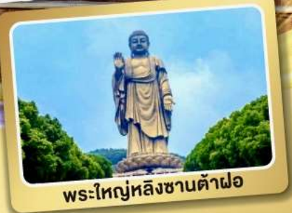
พระใหญ่หลังซานต้าฟอ