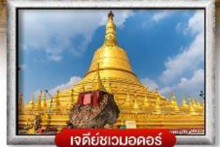
เจดีย์ชเวดากอง

เมนู สุดพิเศษ | กุ้งแม่น้ำเผา + บุฟเฟ่ต์นานาชาติ