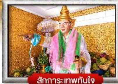
สักการะเทพทันใจ