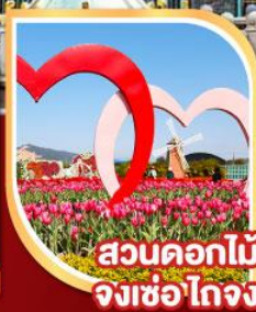
สวนดอกไม้ จงเซอโกจง