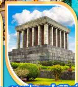
สุสานประธานโฮจิมินห์