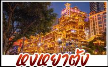
แสงเลขาตั้ง

สัมผัสประสบการณ์เที่ยวจีนแบบเต็มอิ่ม ทั้งความล้ำสมัยของมหานครชิง และความงามตามธรรมชาติของธรรมชาติที่อุหลง ทุกการเดินทางเต็มไปด้วยความสะดวกสบายและคุ้มค่าที่สุดราคา!