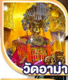
วัดอาน่า