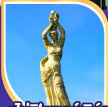
จูโห้พิซเซอร์เกิร์ล