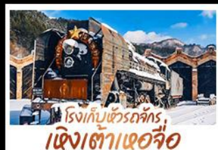
โรงเก็บข้าวรถจักร, เจียงเต่าแฮจื่อ