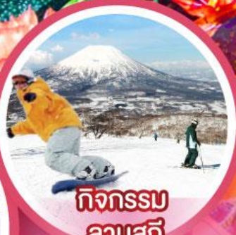
กิจกรรม ลานสกี