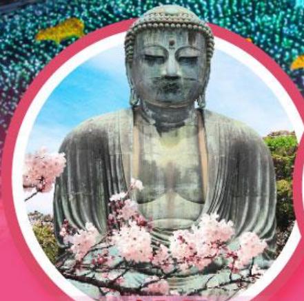
หลวงพ่อดโตโดบุตสึ