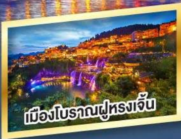
เมืองโบราณฝูหลงเจิ้น