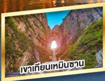
เขาเทียนหมินซาน