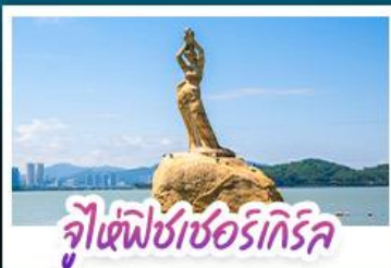
จุฬาราชมนตรี