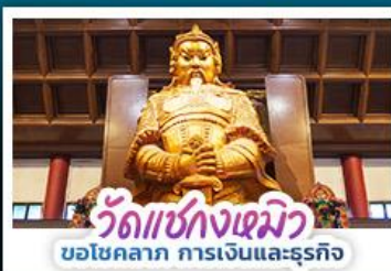
วัดเซ่งกวงเมิว ขอโชคลาภ การเงินและธุรกิจ