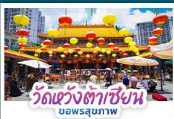
วัดแห่งต้าเซียน บอพรสุขภาพ