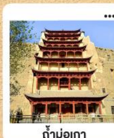
ถ้ำม่อเกา