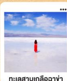
ทะเลสาบเกลือฉาซ่า