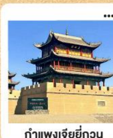
กำแพงเจียยี่กวน