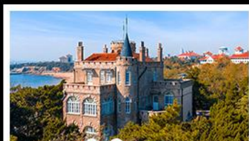
ป่าต่ากวน

พระราชวังฤดูร้อน - วิวเมืองซิงเต่า รถไฟความเร็วสูง - ภูเขาเหลาซาน กำแพงเมืองจีนด่านจวิยงกวน - ป่าต่ากวน พักโรงแรมระดับ 4 ดาว - ไม่หลงร้านช้อปปิ้ง มือพิเศษ เปิดปักกิ่ง , หม้อไฟซีฟู้ด