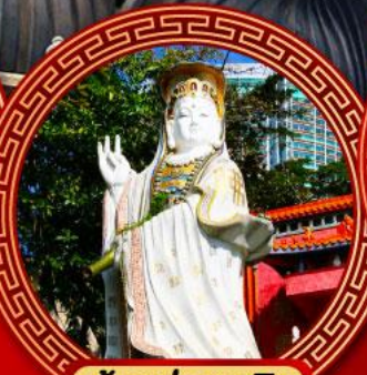
เจ้าแม่กวนอิม รวิฬสเบย์