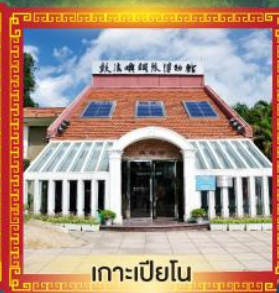
เกาะเปียว