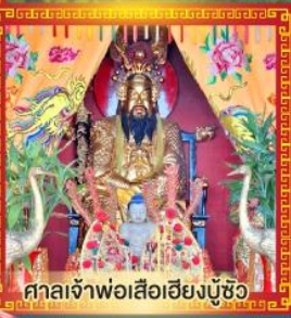
ศาลเจ้าพ่อเสือเฮียงบู๊ซิว