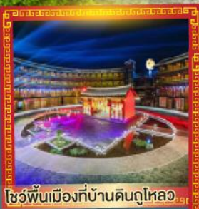
โชว์พื้นเมืองที่บ้านดินกู่ไหลอว