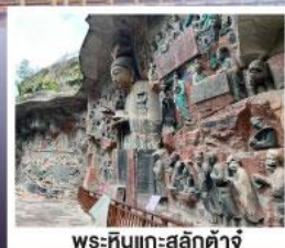
พระหินแกะสลักตำजू