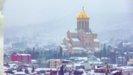
มหาวิหารศักดิ์สิทธิ์ทบิลีซี Holy Trinity Cathedral of Tbilisi