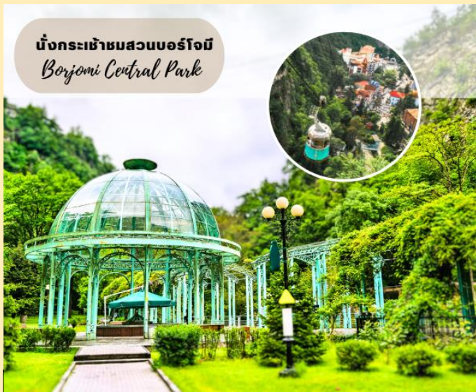
นั่งกระเช้าชมสวนบอร์โจมี Borjomi Central Park

ชมสวนบอร์โจมี (BORJOMI CITY PARK) สถานที่ท่องเที่ยวและพักผ่อนของชาวเมืองบอร์โจมีที่นิยมมาเดินเล่นและผ่อนคลายโดยการแช่น้ำแร่ในวันหยุด จากนั้นนำท่านนั่งกระเช้าสู่จุดชมวิวบนหน้าผาเหนือสวนบอร์โจมี