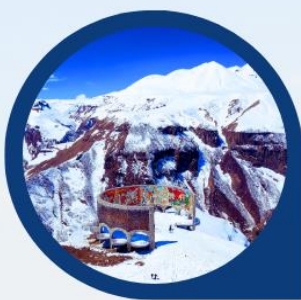
จุดถ่ายรูป Panorama Gudauri

แนวชมป้อมปราการอนานูรี (Ananuri Fortress) ป้อมปราการที่มีความเก่าแก่ของประเทศจอร์เจีย สร้างขึ้นในศตวรรษที่ 16-17 ตั้งอยู่ริมแม่น้ำ Aragvi หนึ่งในแม่น้ำสายสำคัญของประเทศจอร์เจียจากมุมสูง มีทิวทัศน์ความสวยงามของอ่างเก็บน้ำชินวาเลีย (ZHINVALI RESERVOIR) และยังมีเขื่อนซึ่งเป็นสถานที่ที่สำคัญสำหรับนำน้ำที่เก็บไว้ส่งต่อไปยังเมืองหลวง พร้อมใช้ผลิตกระแสไฟฟ้า ที่ทำให้ชาวเมืองทบิลีซีมีน้ำไว้ดื่มใช้ ร่องรอยของซากกำแพงที่ล้อมรอบป้อมปราการแห่งนี้เปรียบเสมือนม่านที่ซ่อนเร้นความงดงามของโบสถ์ 2 หลัง ที่เป็นโบสถ์เก่าแก่ 2 หลัง คือโบสถ์เก่าแก่แห่งพระนางแมรี่ผู้บริสุทธิ์ (The older Church of the Virgin) ส่วนอีกโบสถ์คือโบสถ์ยิ่งใหญ่แห่งอัสสัมชัญ