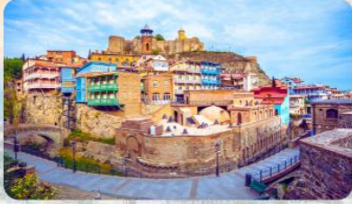
โรงอาบน้ำโบราณ อะบาโนตูบานี Abanotubani Tbilisi Sulfur Baths