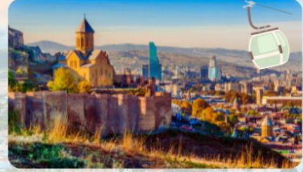
ป้อมนาริกาลา Narikala Fortress