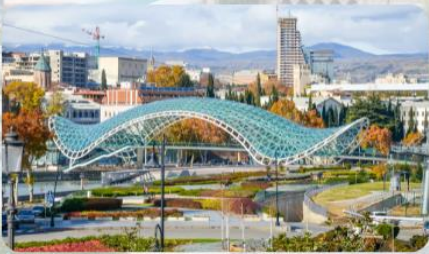
สะพานแห่งสันติภาพ The Bridge of Peace