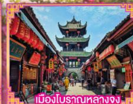
เมืองโบราณหลางจง