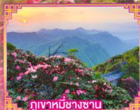
ภูเขาหมื่นชางซาน