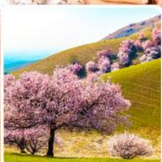
ทุ่งดอกอัลมอนด์