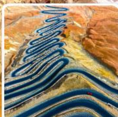
ถนนผานหลงกู่ต้าอว