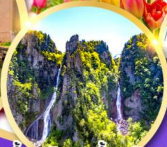
น้ำตกกิ่งกะ-น้ำตกกริวเซ