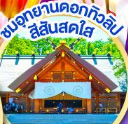
ชมอุทยานดอกทิวลิป สีสันสดใส