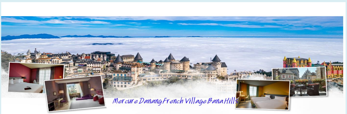
Mercuré Danang French Village Bana Hills

นำท่าน นั่งกระเช้าขึ้นสู่บานาฮิลล์ สัมผัสประสบการณ์ที่น่าตื่นเต้นพร้อมชมความสวยงามมากของธรรมชาติวิวมุมสูง บานาฮิลล์ตั้งอยู่ในจังหวัดดานัง ประเทศเวียดนาม เป็นสถานที่ท่องเที่ยวที่มีชื่อเสียงและยอดนิยมเป็นอย่างมาก และตัวกระเช้าลอยฟ้าเองยังมีความยาวที่สุดในโลกที่เชื่อมระหว่างเทือกเขาและยอดเขาอีกด้วย เมื่อท่านนั่งกระเช้าชมวิวทิวทัศน์ที่สวยงามของภูเขาและป่าไม้ในระหว่างการเดินทาง นอกจากนี้บ้านาฮิลล์ยังมีสถานที่ท่องเที่ยวที่น่าสนใจมากมาย เช่น สะพานทอง (Golden Bridge) ที่มีลักษณะเป็นสะพานที่ถูกถือโดยมือยักษ์ รวมถึงสวนสนุกและรีสอร์ทต่างๆ ที่มีบรรยากาศสุดแสนโรแมนติก