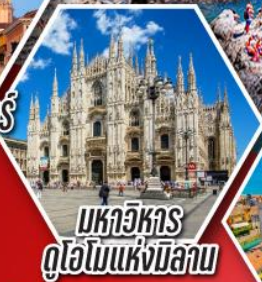
มหาวิหาร ดูโอโมแห่งมิลาน