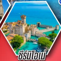
ซังควาเทอร์โร

• อุทยานโดโลไมท์ • นั่งกระเช้าสู่ยอดเขาแอลปี ดิซุสซาเซ • ดินแดนห้าหมู่บ้านซังควาเทอร์โร