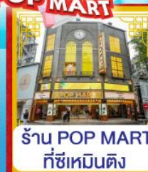
ร้าน POP MART ที่ซีเหมินติง