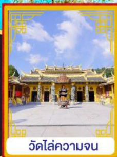
วัดไล่ความจน