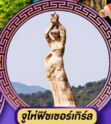
จูไห่พิงเซอร์กิส