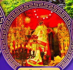
วัดเจ้าแม่กวนอิม ฮ่องฮ่า