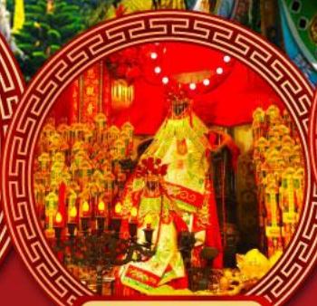
วัดเจ้าแม่กวนอิม ฮองอ่า