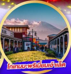
โทเทมบะ-พรีเมียมเอ้าเล็ท